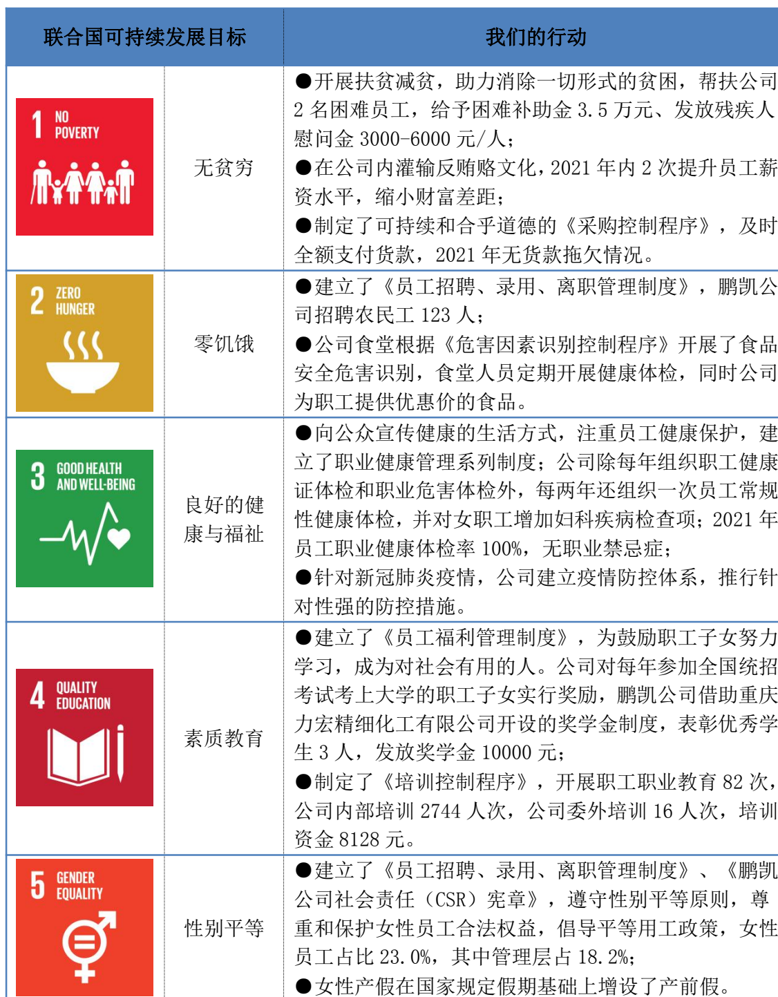
表 4 我们与可持续发展目标

联合国可持续发展目标凝聚了人类对可持续发展的最大共识。作为全球企业公民，鹏凯公司努力发挥自身优势，在满足社会发展和解决共同挑战中寻找机遇，谋求共同发展，创造与利益相关方的共享价值。